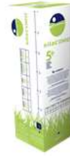
Pellicule de plastique Cordex 30 PO x 1 500M