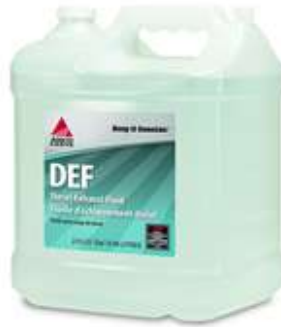
Urée (9.46 Litres)