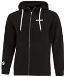
Kangourou Fendt ou Massey (ATCF2018)